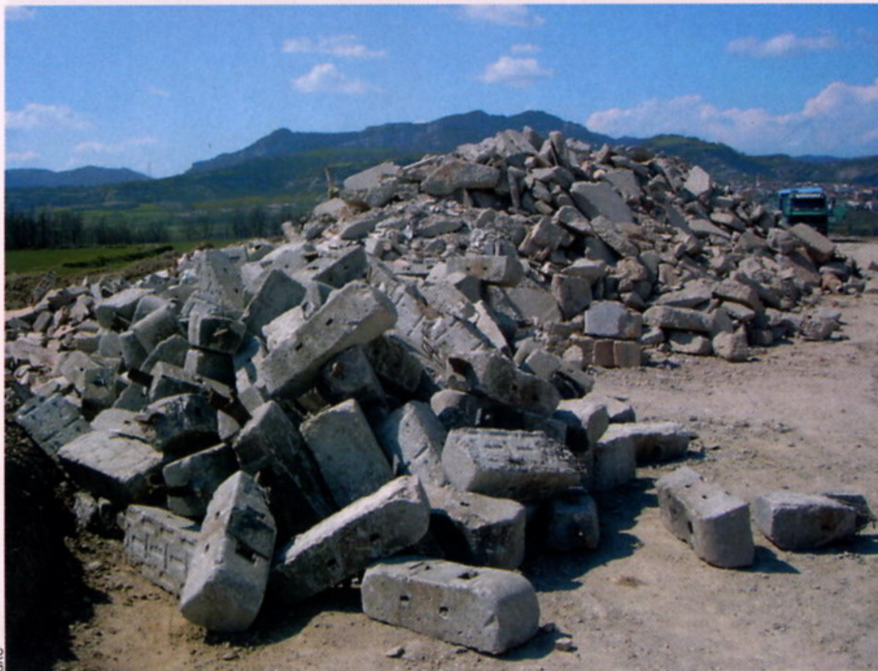
Enderrocs de construcció pendents per a seleccionar, valoritzar i reciclar.

El sector de la construcció genera a Catalunya uns set milions de tones de residus l'any. La rehabilitació, reparació o enderroc d'edificis i infraestructures, el moviment de terres i la mateixa construcció són les activitats que més en generen. Gestionar correctament les runes permetrà minimitzar l'impacte ambiental d'aquestes.