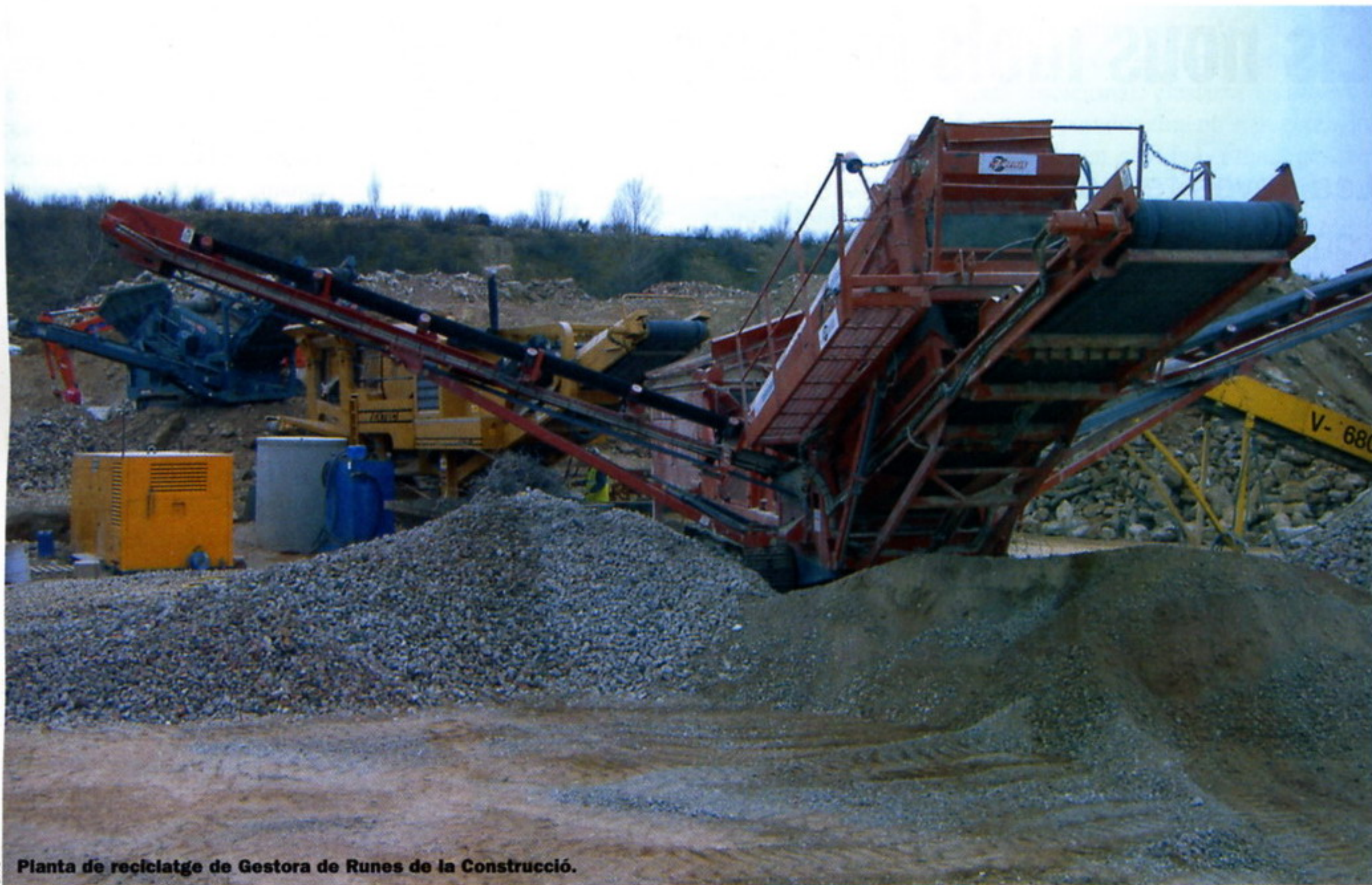
Planta de reciclatge de Gestora de Runes de la Construcció.

part dels residus al cicle productiu de la construcció, mitjançant un procés de trituració i garbellament. El 2006, la Gestora de Runes de la Construcció tenia tretze plantes de reciclatge en funcionament a Catalunya, dues més que l'any anterior. Cada instal·lació elabora productes en funció dels residus que accepta, la maquinària que fa servir i les necessitats de la zona.