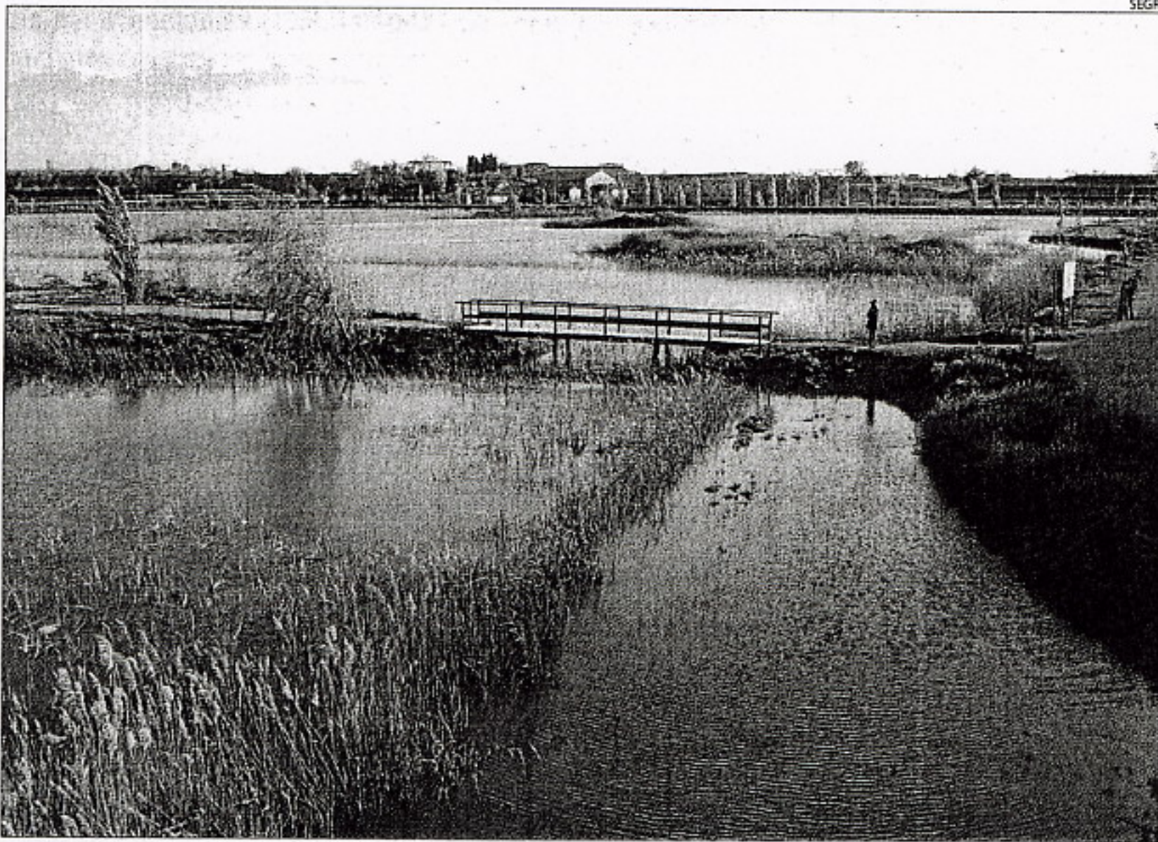
Imatge d'arxiu de l'estany d'Ivars i Vila-sana, que ha estat objecte d'estudi per part d'historiadors de la UdL.