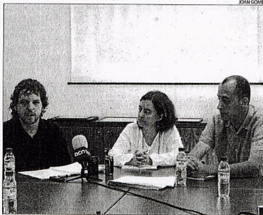
La presentació de l'estudi històric sobre l'estany d'Ivars i Vila-sana.