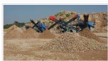
Una planta mòbil de reciclatge.

Gestora de Runes de la Construcció (GRC), empresa mixta que gestiona la deposició controlada dels residus de la construcció i que impulsa la seva valorització i selecció en origen, ha signat un conveni de col·laboració amb el Consell Comarcal de l'Alta Ribagorça. L'acord té per objecte prevenir l'impacte negatiu que té pel medi ambient una gestió incorrecta dels residus de la construcció, com seria per exemple, dipositar aquests materials sense tractar prèviament en espais no habilitats per aquesta finalitat.