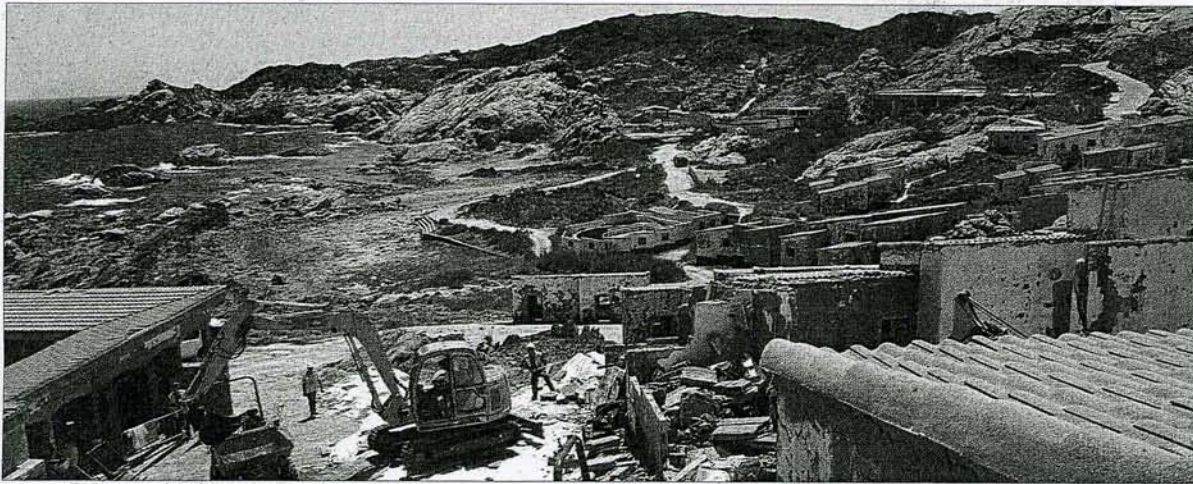
► Obras de desescombro de los bungalós del Club Mediterráneo que ya han sido demolidos, ayer.