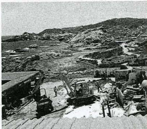
Inicio de recuperación del paisaje del Cap de Creus